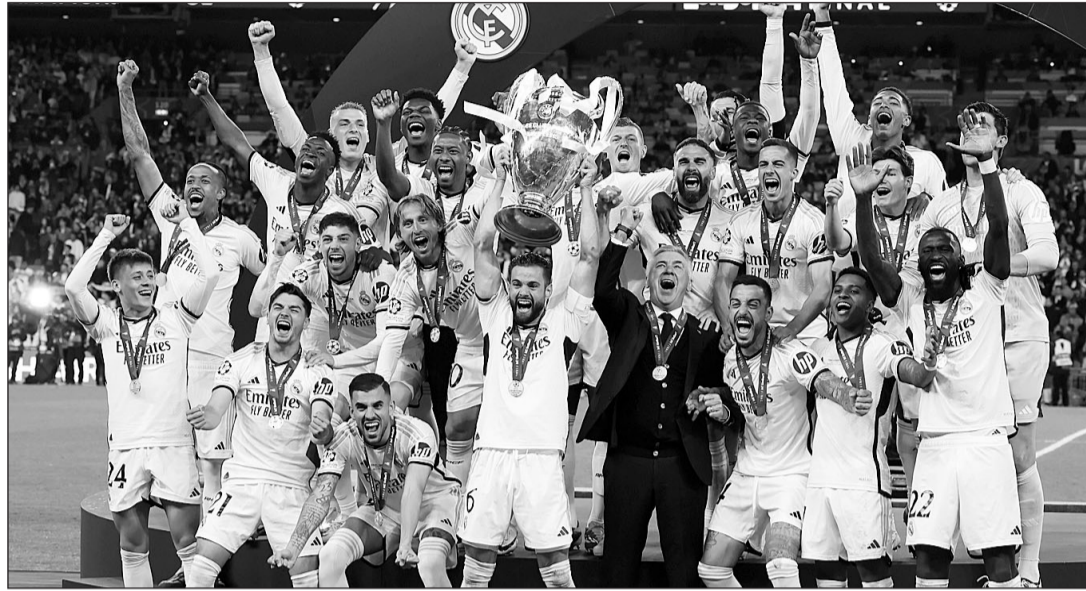
Los jugadores del Madrid celebran el título conquistado.

La caraja del Madrid en los primeros 45 minutos fue descomunal. Salió a tener el balón, pero