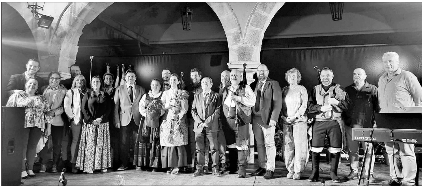
La comunidad gallega local se fotografió con el responsable de Emigración de la Xunta, el pasado 24 de mayo.

El secretario xeral de Emigración, que asistió al evento, destacó el papel de estos centros