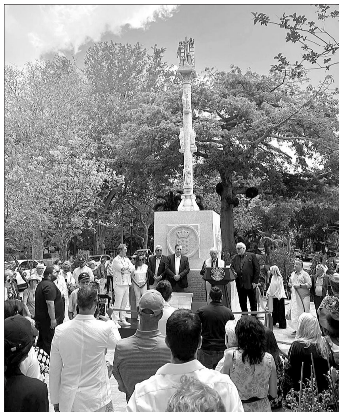
El 'cruceiro' de Miami mide 8,79 metros de altura.

Su construcción se llevó a cabo con donaciones de la comunidad gallega en Miami, cuyos nombres están grabados en la base de la escultura, mientras que el terreno para su ubicación fue donado por la ciudad de Miami.