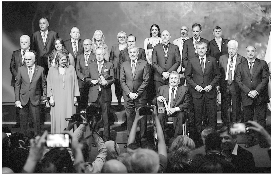
Fernando Clavijo con los galardonados con el Premio Canarias y las Medallas de Oro de Canarias de 2024.

El presidente ha explicado que el debate y el consenso debe servir para “encontrar las claves de nuevas propuestas que consigan un reparto más justo de la riqueza y un pueblo más próspero”. Considera que abordar este reto “requiere del esfuerzo de todos: de una administración pública que sea capaz de