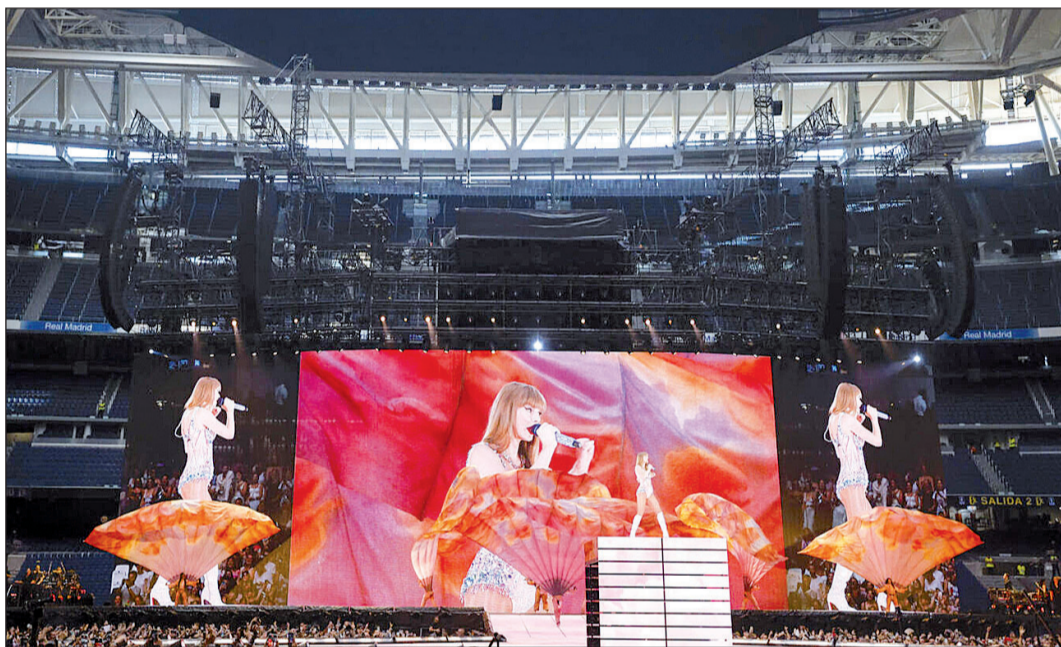
Taylor Swift, en el primero de los dos conciertos que ofreció en el Bernabéu la pasada semana.

La cantante fue recibida con aplausos, vítores y voces coreando su nombre con los primeros acor-