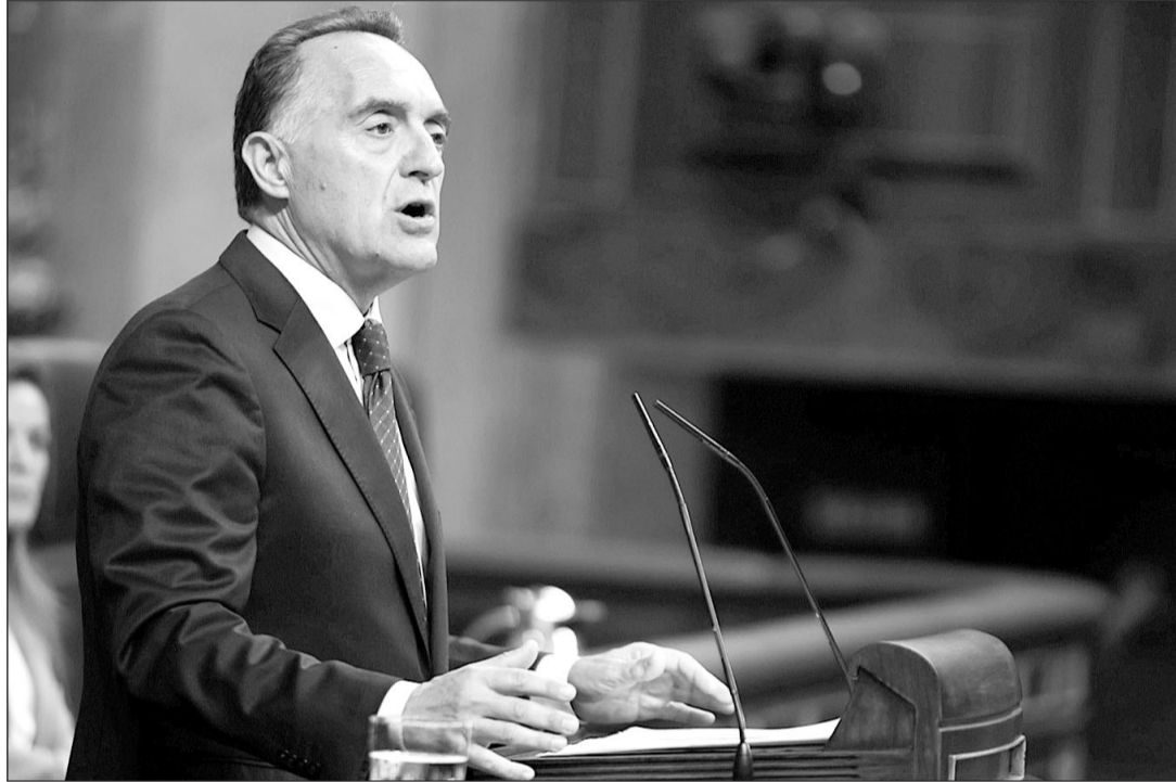
El diputado socialista Artemi Rallo fue el encargado de defender la norma en la sesión del pasado jueves.

El del pasado jueves ha sido un Pleno muy tenso y los insultos se han repetido a lo largo de la votación. Los más sonados se produjeron cuando el presidente del Gobierno, Pedro Sánchez, o la vicepresidenta segunda y minis-