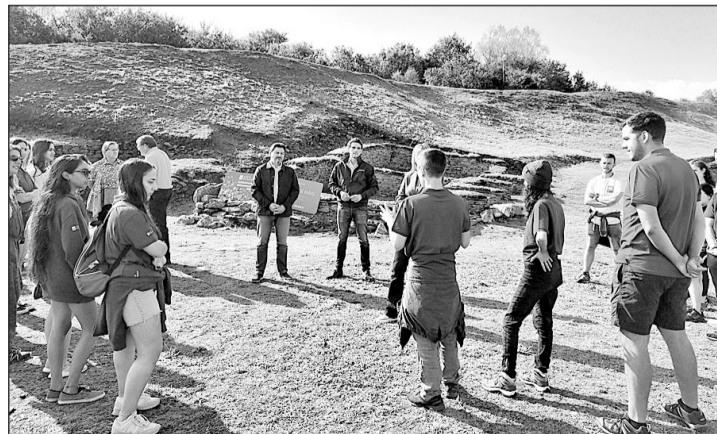
El secretario xeral de Emigración, con algunos de los participantes en el programa de voluntariado en una edición reciente.

Los participantes tienen que haber nacido en Galicia o ser descendientes de una persona emigrante gallega, contar con la na-