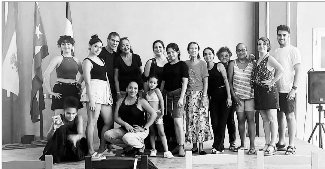
Integrantes de la Asociación ‘La Castañuela Solidaria’ posan junto a directivos y bailarines del Centro.

Pregunta. ¿Cómo se llama la Asociación a la que pertenece,