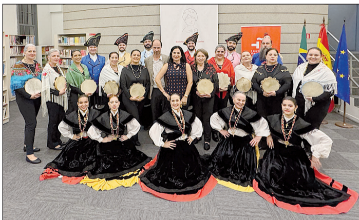
Acto de la Casa de Galicia del Centro Español del Paraná. GM

12 Miami cuenta ya con el único 'cruceiro' desenclavado fuera del territorio gallego