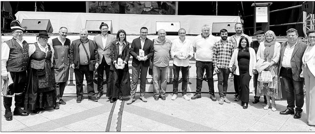
Las autoridades de la Xunta posan junto a directivos de la Irmandade de Centros Gallegos y otros asistentes.

El conselleiro estuvo acompañado por el secretario xeral de Emigración