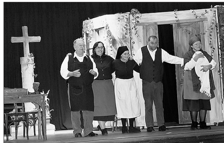
Obra de teatro interpretada por el grupo del Patronato da Cultura Galega.

La celebración culminó con una recepción en la que los asistentes pudieron compartir sus impresiones sobre los actos del día y disfrutar de una selección de gastronomía típica gallega, reforzando así los lazos comunitarios y la identidad cultural de Galicia.