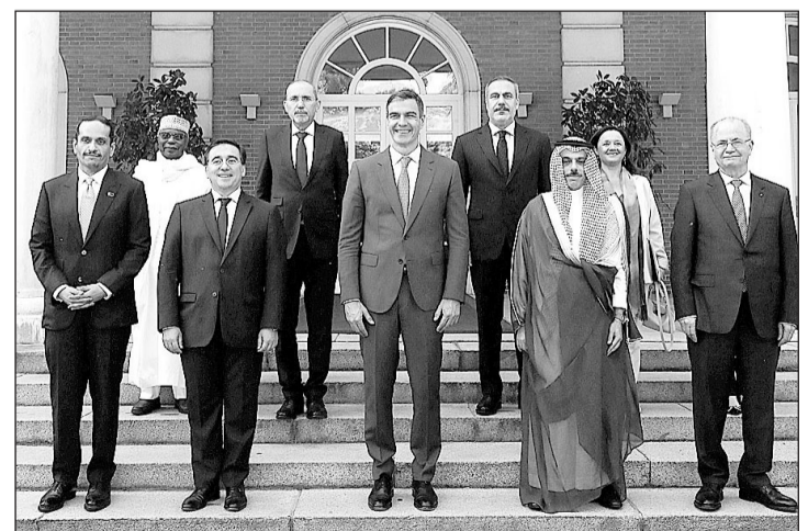
El presidente del Gobierno, Pedro Sánchez, posa junto a los miembros del Comité ministerial árabe-islámico sobre Gaza.

Por su parte, el líder de la oposición, Alberto Núñez Feijóo, se muestra contrario a la decisión de Sánchez y asegura: "Que España reconozca ahora el Estado Palestino hace más daño a los palestinos que beneficio". Al tiempo, pidió "extremar la prudencia" cuando la otra parte del conflicto es una organización terrorista, dijo, en referen-