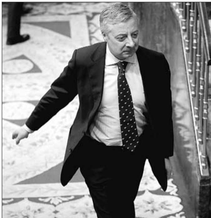
Blanco, exministro socialista y exsecretario de Organización del PSOE.

Así, y según consta acreditado según la defensa, lo único que hizo José Blanco fue comentarle el tema al secretario de Estado de Transportes, Isaías Táboas, para ver si el alcalde podía recibir a Orozco. "No hizo nada; ni habló con el alcalde, ni contactó con él de ninguna forma, ni mucho menos le influyó ni le presionó ni le coaccionó, ni se prevaleció de ninguna relación de superioridad ni de amistad ni de ningún otro tipo