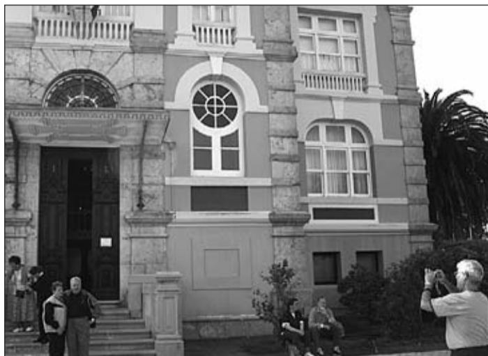
Emigrantes asturianos se fotografían con el Archivo de Indianos, uno de los edificios emblemáticos de Colombres.

En el conjunto destacan elementos como la plaza central de la localidad, dedicada al bene-