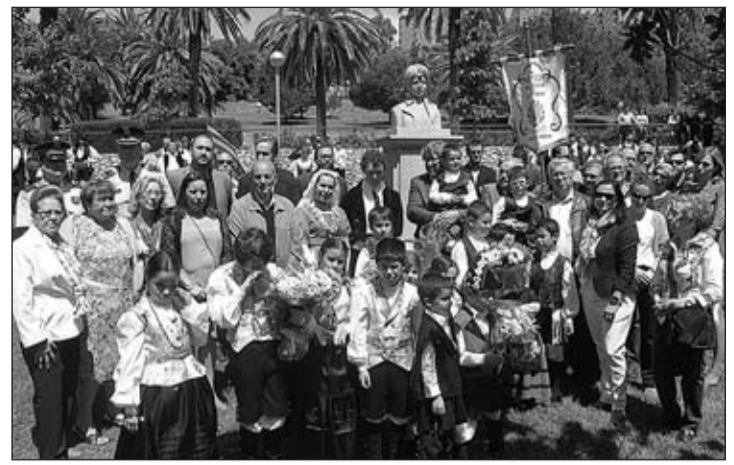
Numerosas persoas deronse cita na ofrenda floral a Rosalía de Castro.

La colonia de ciudadanos nacidos en Galicia ha conseguido en el país centroeuropeo una muy relevante integración social, cultural, e incluso política, teniendo ahora la diáspora gallega un muy alto nivel de consideración por parte de la población autóctona.