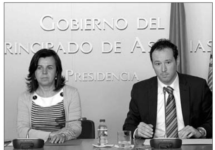
El consejero de Presidencia, Guillermo Martínez, en la rueda de prensa posterior a la celebración del Consejo de Gobierno del pasado día 5.

formó a 73 monitores de 12 países, lo que ha repercutido notablemente en el aumento de bandas de gaitas y grupos de baile en sus centros de origen y en la implicación de jóvenes en estos colectivos. Esta cuarta promoción cuenta con alumnos de España, Bélgica, Argentina, Brasil, Chile y México. En este programa colabora la Federación Internacional de Centros Asturianos, el Instituto Asturiano de la Juventud y el Instituto Adolfo Posada.