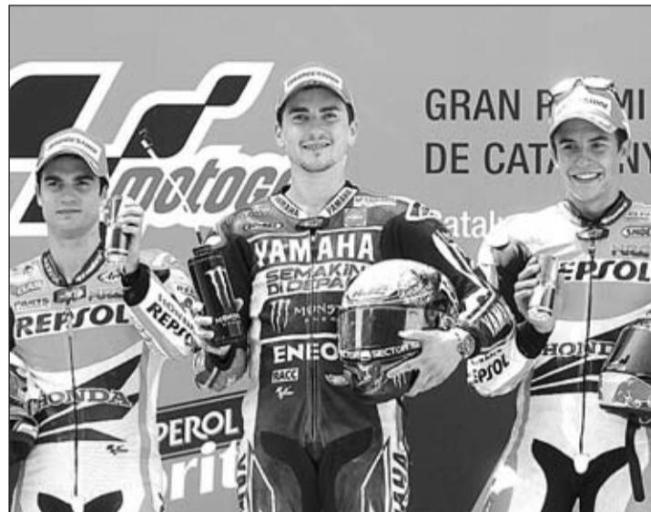
Lorenzo, flanqueado por Pedrosa y Márquez, en el podio de Montmeló.

Pedrosa continuaba al rebufo de Lorenzo, pendiente de estudiar a su rival para buscar el mejor hueco para el 'hachazo', y preocupado también por su retrovisor, en donde Márquez se mantenía al acecho. Muy lejos los tres pilotos españoles de Rossi, tan sólo quedaba por decidir quién ocuparía los tres cajones del podio.