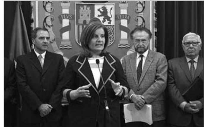
La ministra de Empleo, Fátima Báñez, con algunos de los expertos que han elaborado el informe.

anunció que la Seguridad Social ha logrado un récord histórico en la recaudación ejecutiva acumulada hasta abril, que ha supuesto un aumento del 32,63% con respecto a la conseguida en 2010. Desde el año 2009 se ha incrementado la recaudación en vía ejecutiva, siendo especialmente significativo el aumento experimentado en el año 2012 con respecto al citado año 2009, que superó el 10%.