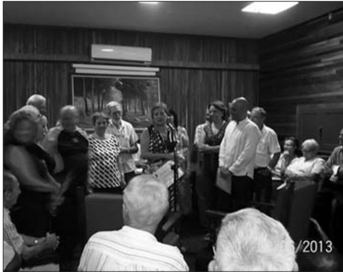
Un momento de la celebración.