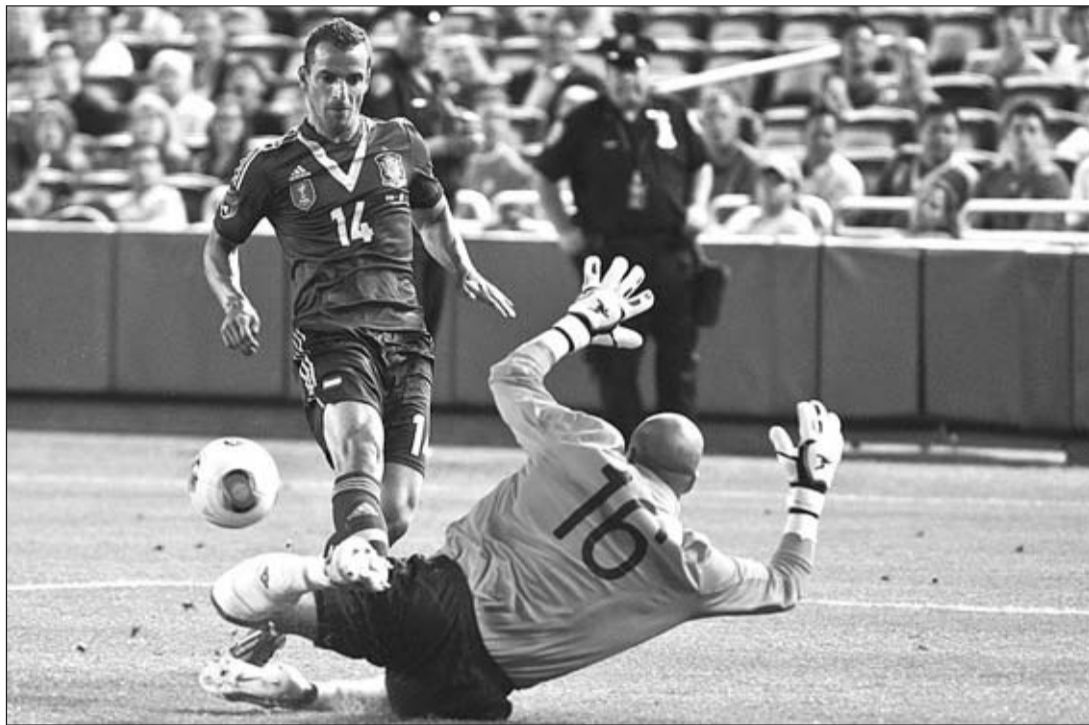
Soldado bate al portero de Irlanda en el amistoso disputado el pasado martes en Nueva York.

El gran escollo de la selección española será Brasil, vencedor de las dos últimas Confederaciones, y amparado en su público. El conjunto entrenado por Luiz Filipe Scolari se apoyará en su gran estrella, el flamante jugador del Barcelona Neymar. Sin embargo, el seleccionador de la 'verdeamarelha' no quiere vender esa imagen.