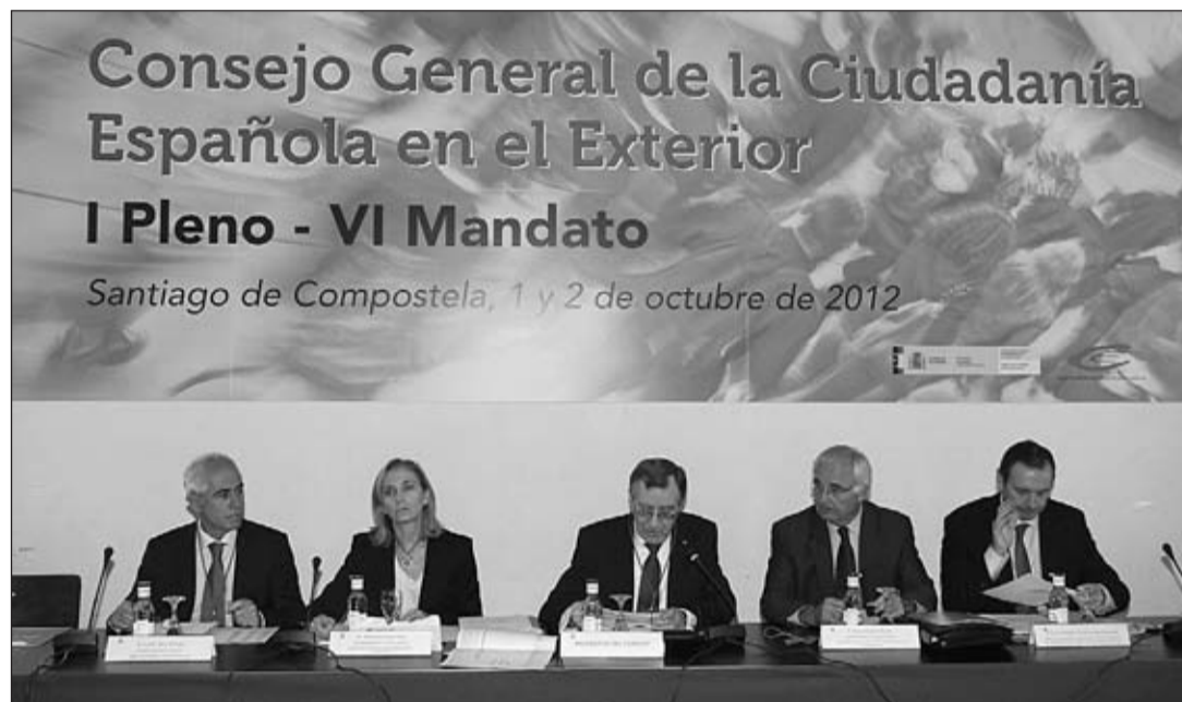
Un instante del acto de inauguración del último Pleno celebrado, que tuvo lugar en Santiago en octubre de 2012.

La Comisión Permanente del Consejo General de la Ciudadanía Española en el Exterior (CGCEE) se reunió en el mes de marzo con el fin de estudiar las propuestas para dotar de un nuevo Reglamento de funcionamiento a este órgano consultivo del Ministerio de Empleo y Seguridad Social. La reforma del actual Reglamento parte de una necesidad, detectada en el anterior Mandato, de actualización de algunos de sus puntos, ya sea por cambios habidos durante su periodo de vigencia en diversas normas que le afectan, o por razones operativas, observadas en su aplicación.