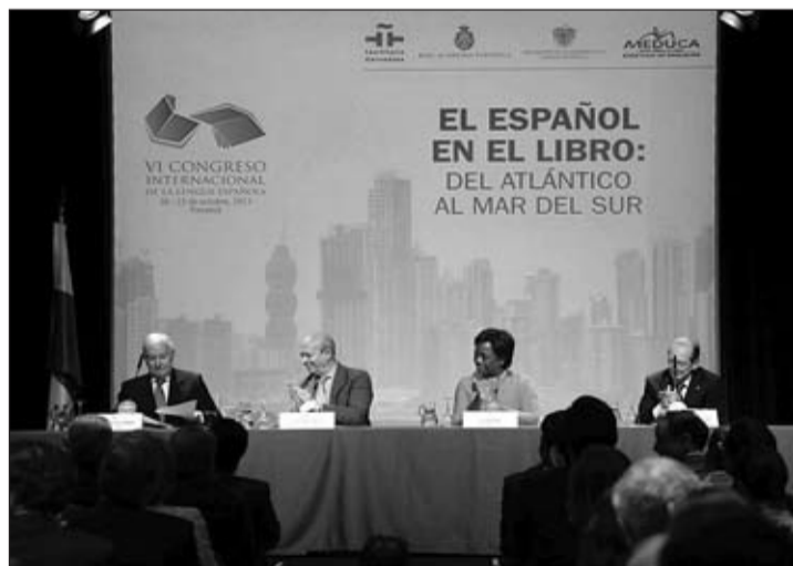
Un momento de la presentación en Madrid del Congreso.

Esta nueva edición del CILE se inscribe en la serie de congresos internacionales promovidos por el Instituto Cervantes, la Real Academia Española (RAE) y la Asociación de Academias de la Lengua Española (ASALE) y, en esta ocasión, también por el Gobierno de Panamá como país anfitrión. El congreso se enmarca dentro de las conmemoracio-