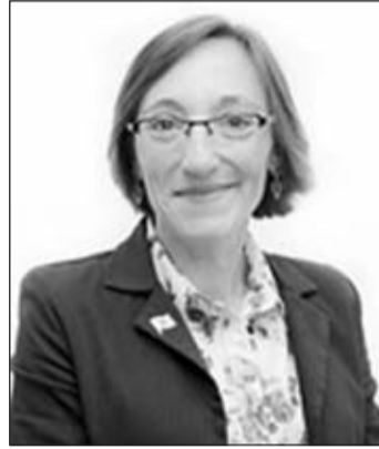
Rosana Pérez, diputada del BNG.

La diputada del BNG en el Congreso Rosana Pérez presentó una proposición no de ley y una iniciativa parlamentaria en la Cámara que insta al Gobierno a mantener operativa la Agencia Consular de Basilea en Suiza dado el alto número de emigrantes gallegos que viven y trabajan en el país helvético, y que precisan de una