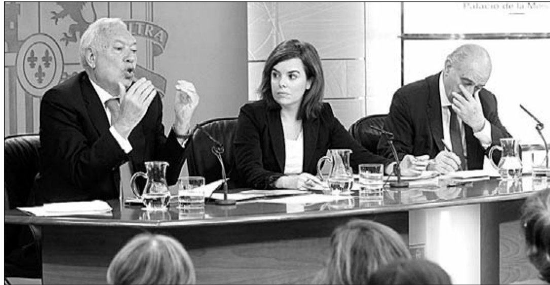
García-Margallo -1º por la izda.-, durante su intervención en la rueda de prensa posterior al Consejo de Ministros.

“Se trata de tener una orquesta y no un conjunto de solistas desafinados”, dijo en referencia a la necesidad de aunar y coordinar esfuerzos entre el Estado y el resto de agentes que puedan operar en la acción ex-