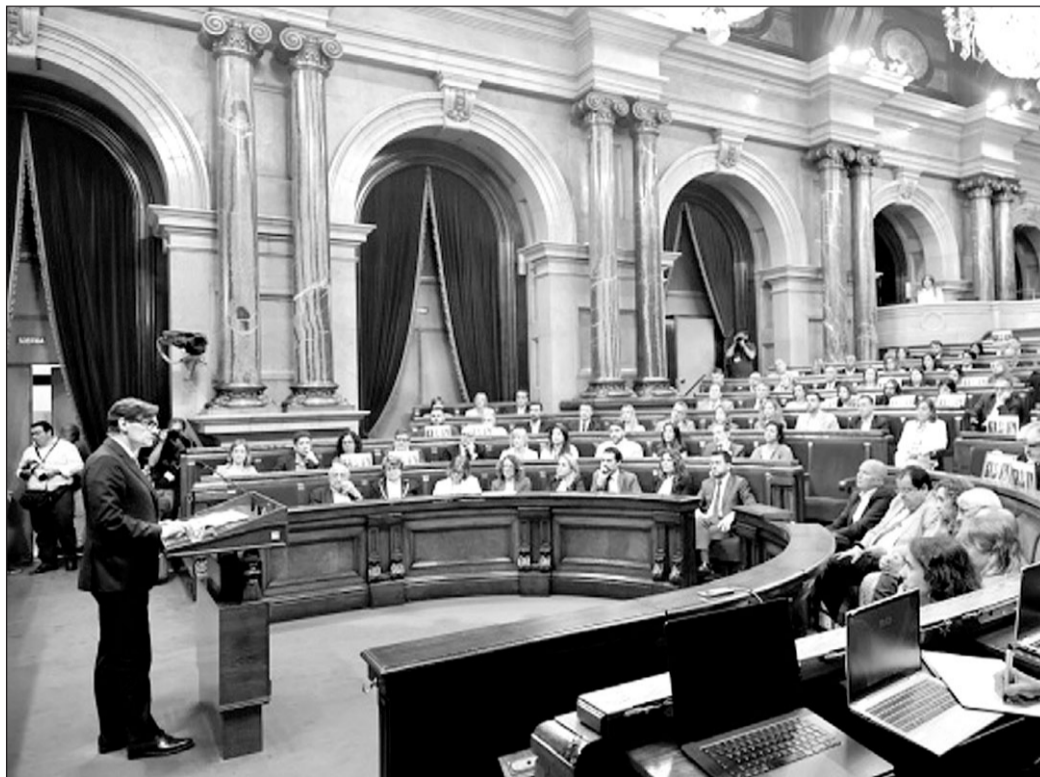
Salvador Illa, durante su intervención en el pleno equivalente a una investidura fallida, el pasado día 26.

Rull ha solemnizado ante el pleno la activación de la cuenta atrás de dos meses para investir a un nuevo presidente de la Generalitat y evitar así una repetición electoral, ante la ausencia por ahora de candidato oficial, después de que tanto Illa como