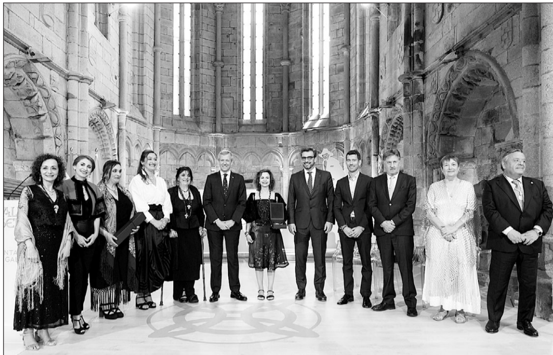
Alfonso Rueda, con los premiados en la edición de 2024 de las Medallas Castelao.

En presencia de los representantes de la Comisión Delegada del Consello de Comunidades Galegas, que se reunió un día antes en la capital compostelana, el presidente autonómico aseguró que debemos mostrarnos “orgullosos y eternamente agrade-