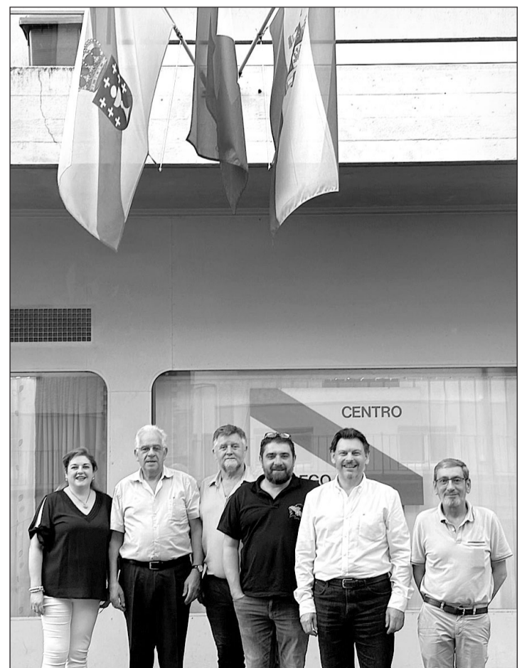
El secretario xeral, durante la visita a uno de los centros.