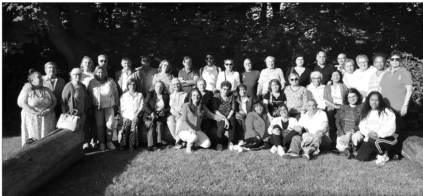
Foto de grupo de los asistentes al taller organizado por la Coordinadora.