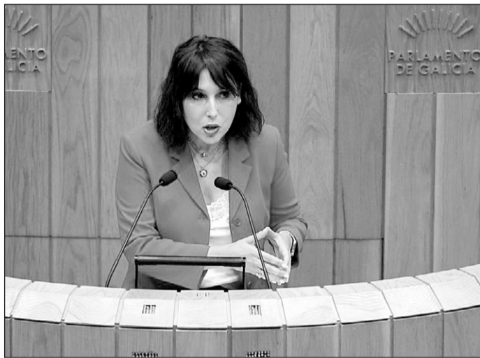
La conselleira de Economía, durante su intervención en el Parlamento.

Así, avanzó que la valoración de los beneficios sociales y económicos de las iniciativas cuya autorización sea de competencia autonómica se integrará dentro de la evaluación de su impacto ambiental, que se hará de acuerdo con la legislación estatal y autonómica aplicable, si fuera preceptiva, para establecer las medidas que permitan prevenir, corregir y,