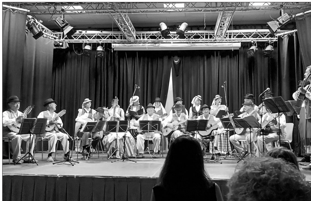
Actuación de la Parranda Sentimiento Canario, durante el Festival de Folklore.

La gala, que tuvo lugar el pasado sábado 22 de junio, en el Centro de Convivencia de mayores Laín Entralgo de Zaragoza, contó con la participación de la Parranda Sentimiento Canario, la Asociación Cultural Casa Regional ‘Hogar Extremeño de Zaragoza’ y la Asociación Cultural Xinglar, de folklore tradicional aragonés.