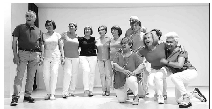
Las alumnas y el alumno del grupo de iniciación de Baile en Línea.

La directiva dice que “estos actos son una oportunidad para cuidar la interrelación entre los socios”