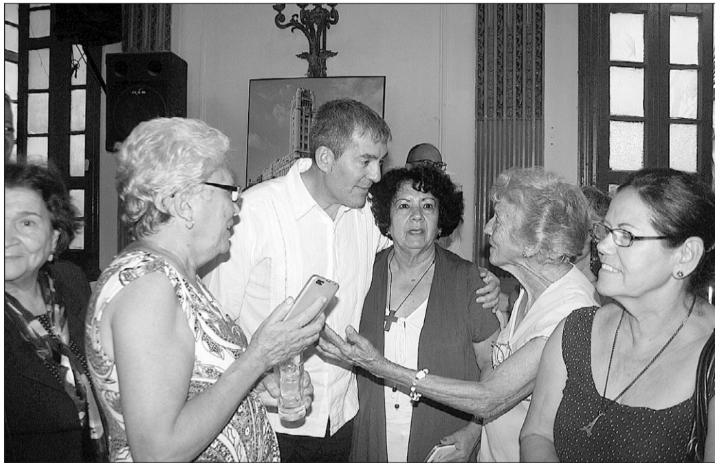
Fernando Clavijo conversa con descendientes de canarios en su último viaje a Cuba.

Según informa la web prensa-latina.cu, Durán precisó que no se descarta que aparezcan en el resto del país sobre todo en