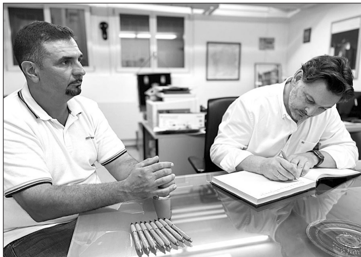
Miranda firma en el libro de honor de uno de los centros que visitó.

análisis de las actividades culturales y recreativas que se están desarrollando.