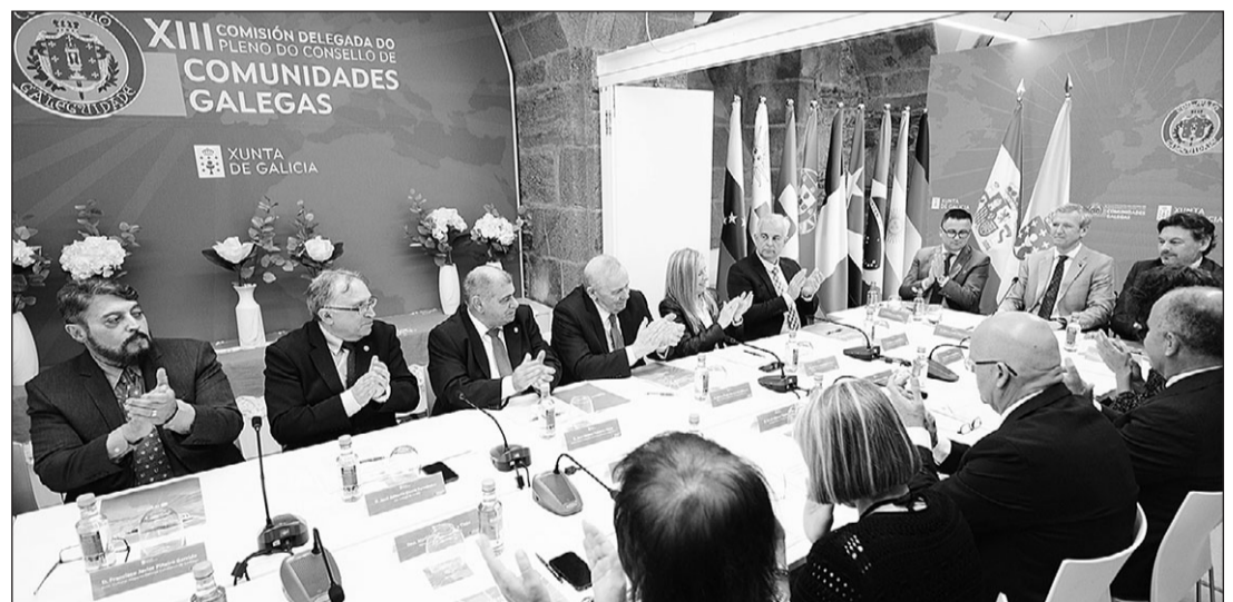
Los miembros de la Comisión Delegada aplauden al presidente Rueda al término de su intervención.

En referencia a la adscripción de las competencias de Emigración en la Consellería de Emprego, Comercio e Emigración, Rueda les aseguró que “veréis que fue un acuerdo para ser más eficaces y poder atenderos mejor. No quiere decir para nada pérdida de la enorme importancia que le damos al Consello de Comunidades Galegas y a la Galicia exterior”.