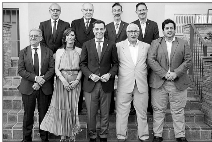
El presidente andaluz, con directivos de la entidad y otras autoridades.

Durante su visita a Tarragona, Moreno ha estado acompañado