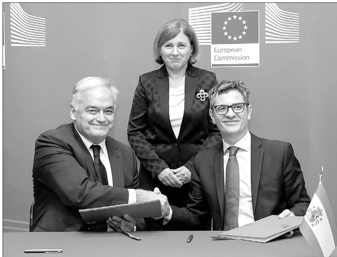
Félix Bolaños —a la dcha.— y Esteban González Pons se saludan tras la firma del acuerdo para la renovación del CGPJ.

Por otra parte, la proposición de ley establece que en el seno del CGPJ se creará una comisión de cinco vocales que informará de todos los nombramientos discrecionales que deba hacer el pleno, que deberá elegir a los altos cargos de la judicatura con