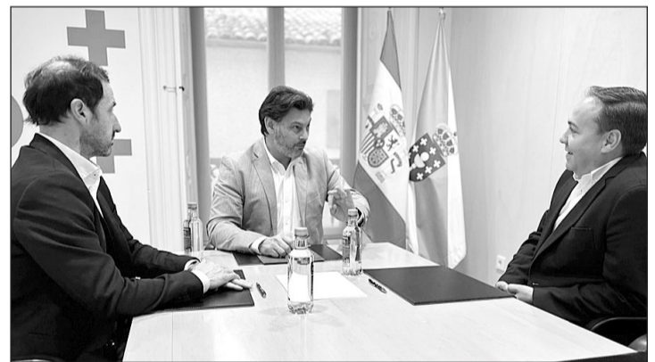
Los representantes de la Casa Galega O Noso Lar, con Miranda.

Los premios Rebulir resaltan el esfuerzo de las entidades gallegas del exterior en mantener vivos los lazos culturales y en enriquecer la diversidad cultural global.