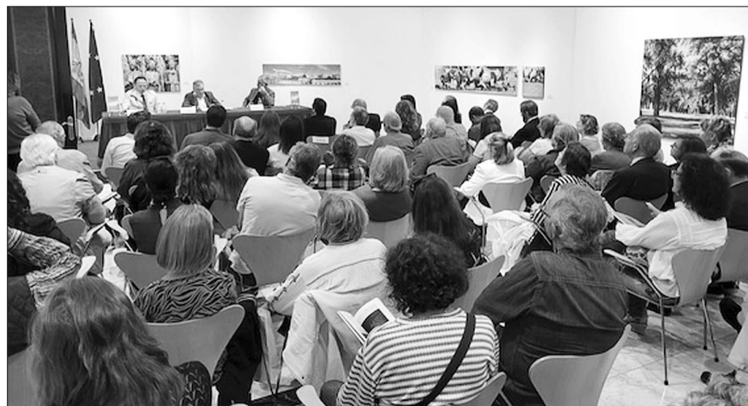
Numerosas personas se dieron cita en la presentación del libro 'Ourense, muy cerca' en la Casa de Galicia.

Paralelamente, conocemos al otro protagonista, el ruso Arsenyev, un nihilista unido a su líder, Pléjanov, el padre del marxismo ruso, en su exilio por Europa.