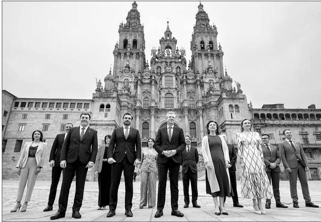
Alfonso Rueda —en el centro—, con los miembros del nuevo Gobierno gallego, en la compostelana Praza do Obradoiro.

En su currículum figura que fue vocal nato del comité y del pleno del Consorcio de la Zona Franca de Vigo desde 2009 a 2014, así como representante de