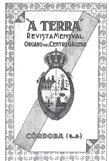
Portada de un número de la revista.

'Repertorio da prensa da emigración galega', un proyecto que busca difundir el patrimonio documental producido por la comunidad gallega del exterior y que, hoy en día, mantiene actualizado el Arquivo da Emigración Galega del Consello da Cultura Galega. En él se recopila una relación de las publicaciones gallegas (boletines, periódicos de información general, revistas culturales, prensa política, revistas y boletines internos de las asociaciones de emigrantes, publicaciones institucionales etc.) editadas tanto por las asociaciones de emigrantes como por figuras destacadas de la colectividad gallega. Aunque los números de las diferentes cabe-