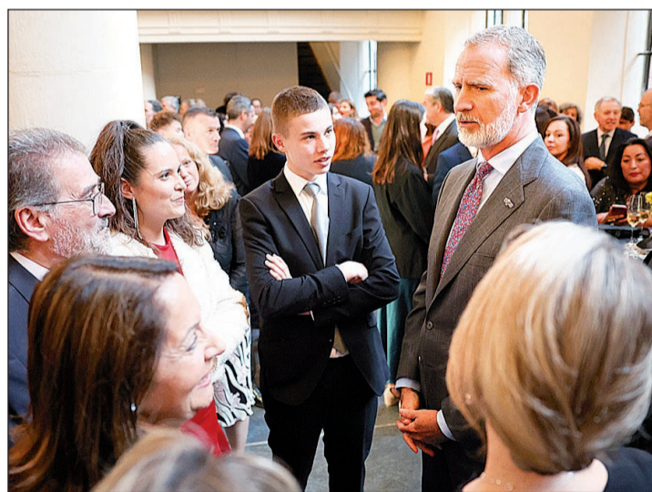
El Rey conversa con un grupo de españoles en la Embajada.