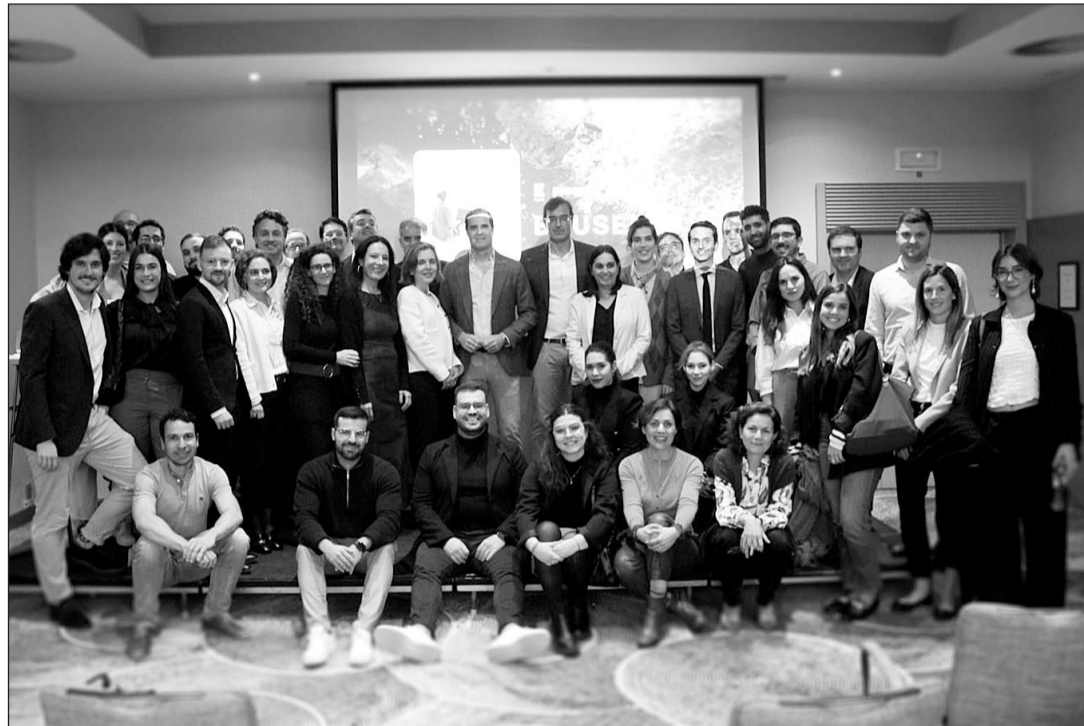
Asistentes al encuentro que tuvo lugar en Bruselas.

El encuentro, el segundo que se realiza fuera de las islas y el primero que tiene lugar lejos de España, forma parte del plan de acción Proexca Talent, uno de los servicios que ofrece la empresa en aras de la formación, capacitación y atracción de talento para el desarrollo econó-