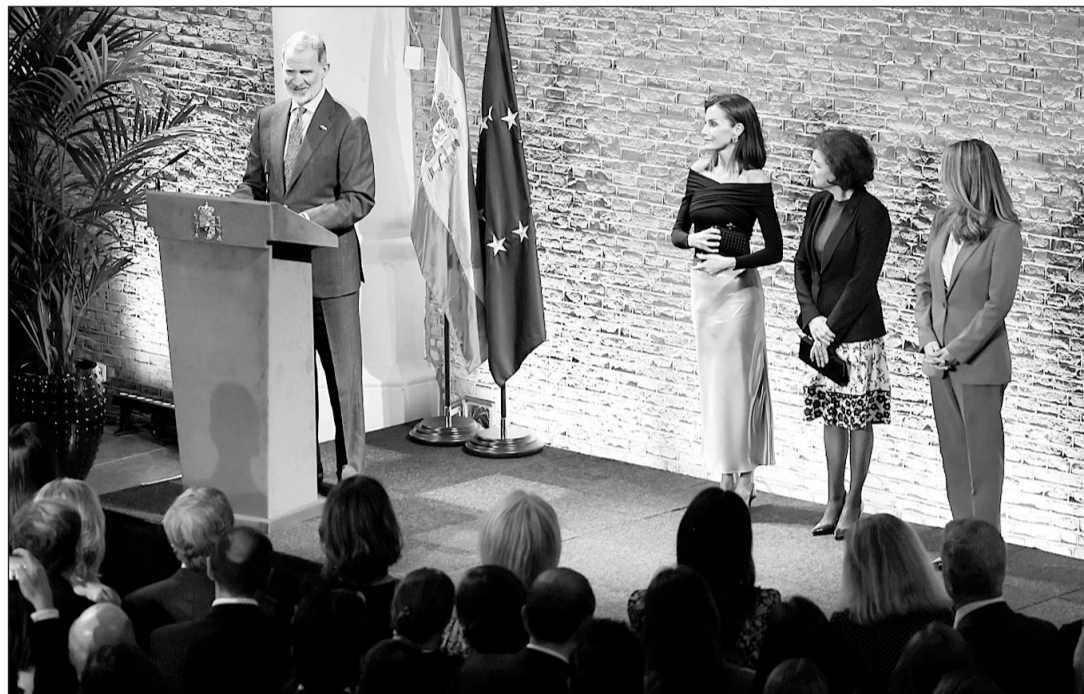
El Rey, durante su intervención ante la colectividad española en Países Bajos.

También, agradeció la contribución de la colectividad española “a la ‘Marca España’, a exten-