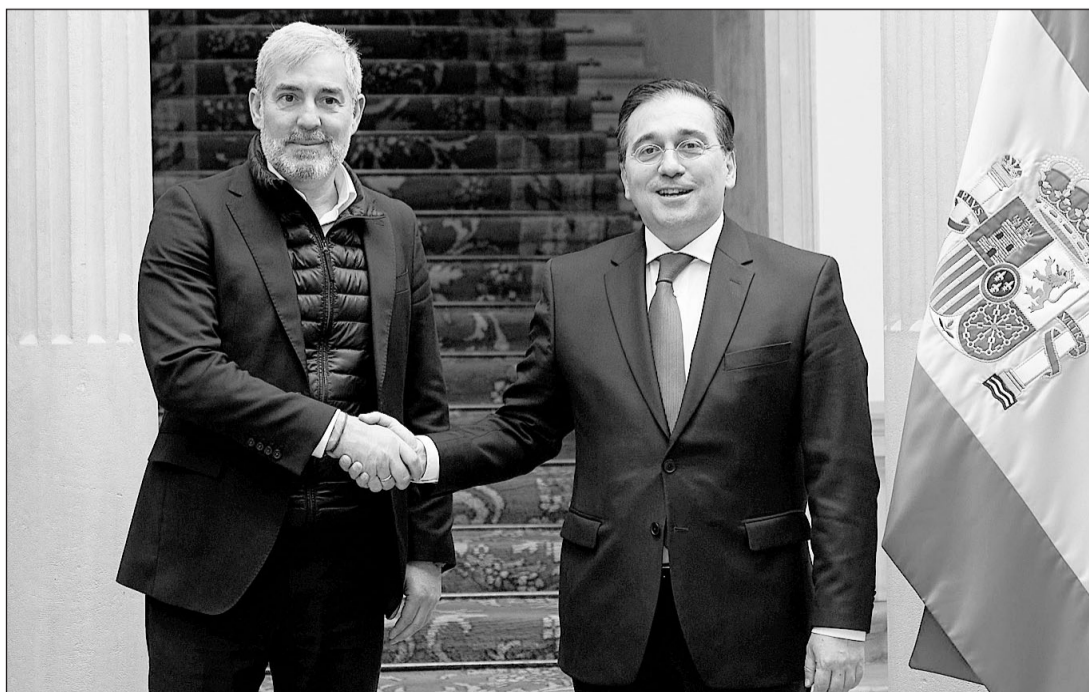
Fernando Clavijo y José Manuel Albares, durante el encuentro.