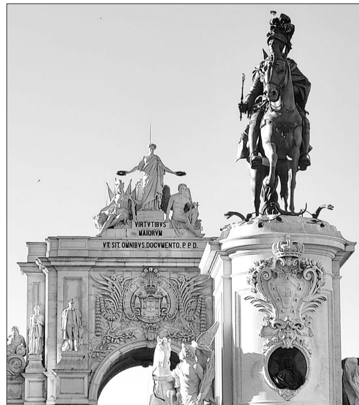
Una imagen de la Lisboa monumental.