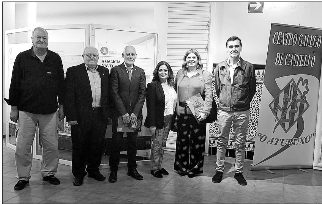
Algunos de los asistentes a la inauguración de la muestra en Castellón.

El proyecto expositivo muestra la posición que ocupaba Galicia en el comercio con las Américas en aquella época y las consecuencias que tuvo para el país la expedición Magalhães-Elcano. El éxito de aquel viaje permitió que el viejo reino gallego, que había sido descartado por los Reyes Católicos como núcleo de la Carrera de las Indias a favor de