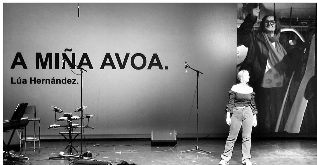
El espectáculo homenajeó a mujeres de todas las clases sociales y familiares.

Todos los alimentos y productos infantiles al término de la sesión fueron cogados en furgone-