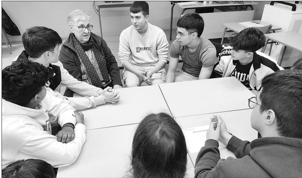
Una de las personas que participaron en la iniciativa comenta su experiencia a un grupo de alumnos.

El proyecto proporciona un marco de aprendizaje no formal que favorece la curiosidad, la empatía y la motivación del alumnado, al tiempo que contribuye a es-