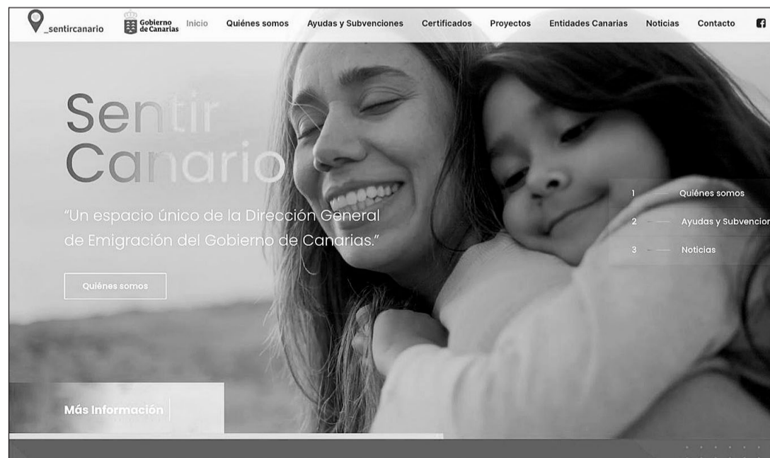
Portada de la nueva página web de Sentir Canario.