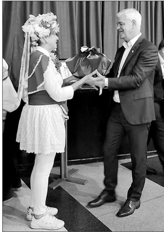
El presidente del Cabildo de El Hierro, durante la entrega de regalos.