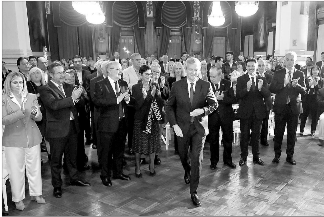
Alfonso Rueda, en el acto del 170º aniversario del Club Español de Buenos Aires en su último viaje a Argentina, en octubre de 2022.

Rueda recordará que todos aquellos que deseen volver a Galicia contarán con la Xunta a través de la Estratexia Galicia Retorna