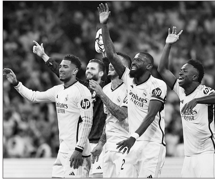
Los jugadores del Real Madrid celebran con el público la victoria lograda.

El Real Madrid había igualado en dos ocasiones el marcador. En la primera parte con un gol de Vinicius Junior, de penalti, en el minuto 18 tras el tanto de cabeza de Andreas Christensen en el 6. Y en la segunda mitad, Lucas Vázquez puso el 2-2 en el minuto 73 después del tanto de Fermín López en el 69.