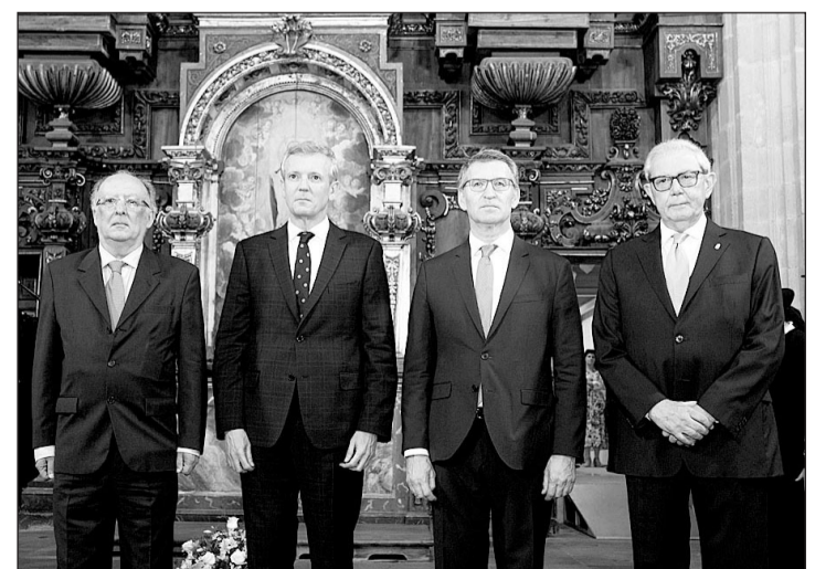
Alfonso Rueda, acompañado por los expresidentes Fernando González Laxe, Alberto Núñez Feijóo y Emilio Pérez Touriño en San Domingos de Bonaval.

Su compromiso se basa en “aportar mi modesto grano de arena a la gran tarea que otros iniciaron y otros continuarán”, proclamó. Rueda, quien entró en el parque compostelano con la música de la Banda de Gaitas de Pontevedra, estuvo acompañado del ministro de Transportes, Óscar Puente, representante del Gobierno en el evento.