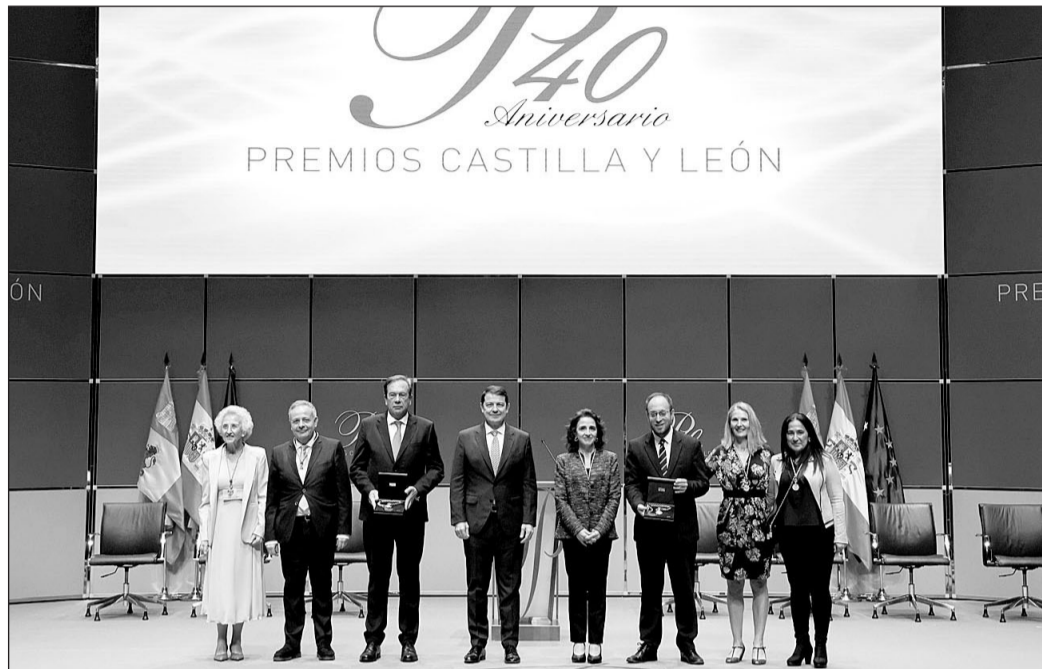
El presidente Mañueco posa con todos los premiados.

Esta sólida situación económica se traduce en que continúa aumentando la creación de empleo y, también, permite mantener un elevado nivel de servicios públicos, revalidando el liderazgo nacional en atención a la dependencia; con la mejor educación de España y una de las mejores del mundo, como cons-